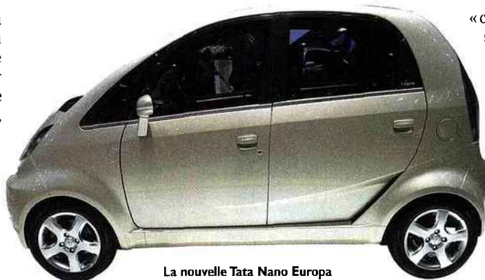
La nouvelle Tata Nano Europa

BASIQUE (RETOUR AU). Rien de mieux pour faire baisser les prix que de simplifier les produits. La vente des mini-ordinateurs, les netbooks , entre 300 et 500 euros explose [voir la ru